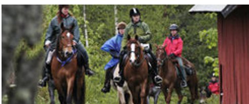
Ridlederna invigdes år 2006. Nu finns 25 mil som även nyttjas som vandringsleder.

Kartan och fakta finns med i Nyhetsbrevet.