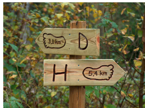
Årligt underhåll av leder kostar peng.

Om servicen sas att bygden har tunt med matställen där man kan få lagad mat samt övernattning med dusch, tv etc.